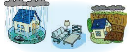
水災リスク（豪雨・土砂崩れ等）