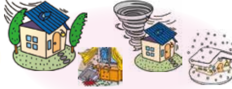
風災リスク（台風・竜巻・雪災等）