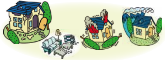
地震リスク（倒壊・火災・津波）