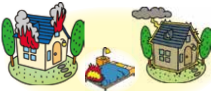
火災・落雷等リスク