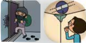
盗難・水漏れ等リスク